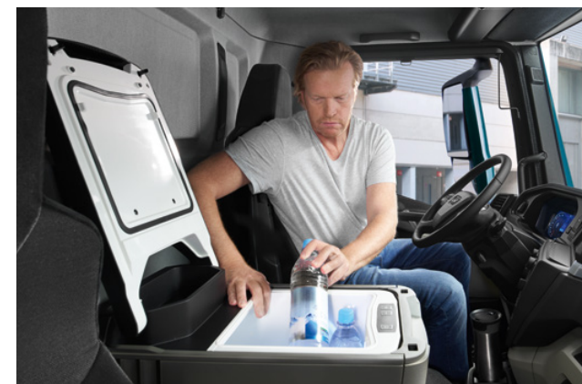
Optimal pour l'auto-suffisance: glacière/réfrigérateur à bord.

Le bruit et la lumière restent à l'extérieur: une isolation supplémentaire du sol et de la paroi arrière ainsi qu'une isolation thermique optimisée dans les grandes cabines et des rails qui se chevauchent pour les rideaux de pare-brise établissent réelle-