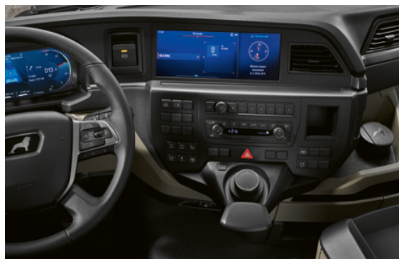
Système d'infodivertissement avec écran 12 pouces et MAN SmartSelect

Vous pouvez piloter le système via un panneau de commande classique à touches et par MAN SmartSelect à partir de la version Premium du système multimédia MAN. En plus de cela, le système autorise une prise en main familière allant de pair avec un confort innovant. Le résultat est visible et palpable: les surfaces de haute qualité offrent une sensation particulière, pour chaque trajet, à bord des nouveaux MAN TGM et TGL.