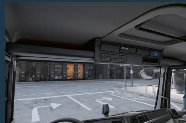
Les deux compartiments de rangement ouverts et spacieux situés au-dessus du pare-brise peuvent être utilisés pour ranger les objets à portée de main.

En fonction de la cabine, ils sont disponibles en différentes tailles, tout comme le réfrigérateur et d'autres tiroirs. Cela signifie que la cabine est toujours parfaitement adaptée aux différents besoins du conducteur.