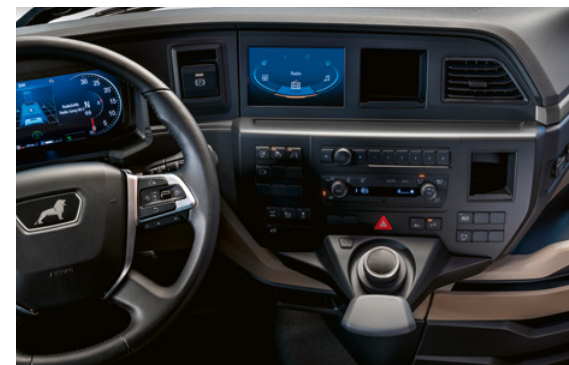
Système d'infodivertissement avec écran 7 pouces et MAN SmartSelect