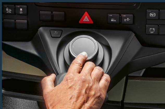
Commande innovante MAN SmartSelect pour les systèmes multimédia.

Celui-ci est parfaitement utilisé dans les deux véhicules pour intégrer des espaces de rangement qui simplifient l'ordre dans la cabine. Que ce soit les compartiments de rangement du toit au-dessus du pare-brise ou les différentes possibilités de rangement dans la zone centrale ou au niveau du siège passager.