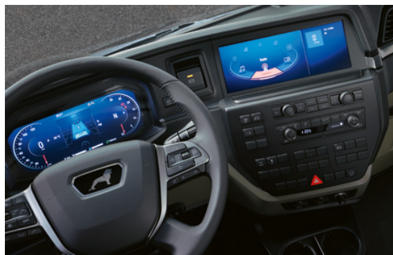
Système d'infodivertissement avec écran 12 pouces et commutateur de sélection